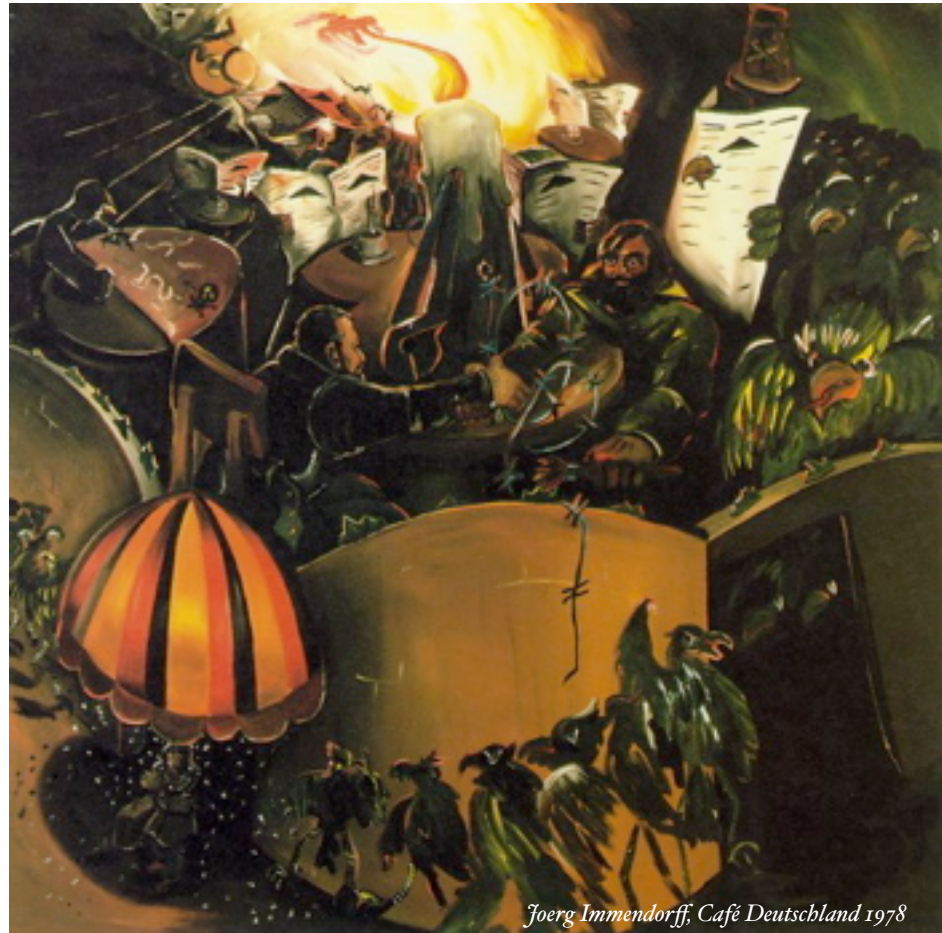
Joerg Immendorff, Café Deutschland 1978

door de Amerikaans-Russische schrijver Joseph Brodsky in zijn verzamelde opstellen On Grief and Reason 24 . Als oorzaak van de verveling noemt hij de neiging van de gehaaste stadsbewoner om wat één keer is gelukt schier eindeloos te herhalen. “Repetition is boredom’s mother”, schrijft Brodsky in zijn essay In Praise of Boredom . 25 Hier tegen helpt alleen een speelse, creatieve aard. Jonge mensen hopen op eigenschappen als oorspronkelijkheid en rijkdom aan invallen, volgens Brodsky. Maar de natuur heeft het helaas niet op voorraad liggen. Het leven blijft voor de meeste mensen rechtlijnig, saai en is er niet op aangelegd hun fantasieën en andere droombeelden zomaar in vervulling te doen gaan. Soms biedt de kunst een safe vluchtweg. Ofschoon ook hier de monotonie – in de vorm van clichés – op de loer ligt. De niet-kunstenaar zal het moeten doen met de hypes en ingeblikte emoties van de media, de amusementsindustrie, de mode, of de politiek om zijn leven wat op te fleu-